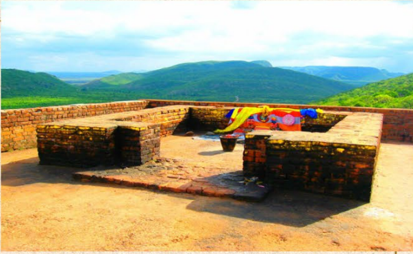
เขาคิชฌกูฏ ราชคฤห์