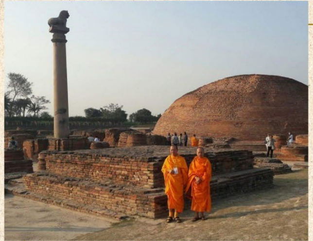
กุฎาคารศาลาวัดป่ามหาวัน