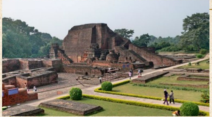
วัดเวฬุวัน

ราชคฤห์ - เขาคิชฌกูฏ ราชคฤห์ - หลวงพ่อองค์ดำ - มหาวิทยาลัยนาลันทา - พุทธคยา