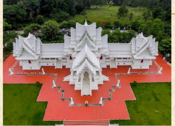
วัดไทยลุมพินี