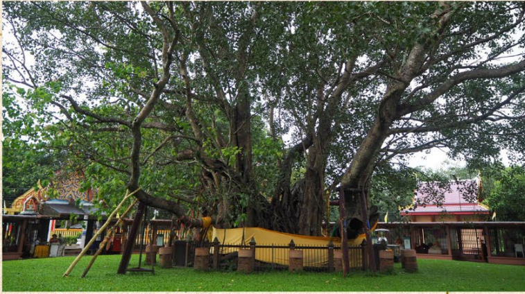
ต้นศรีมหาโพธิ์