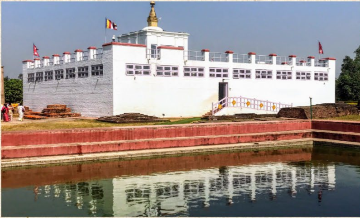
สวนลุมพินีวัน