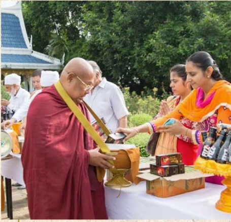
สระมัจฉิณัจ