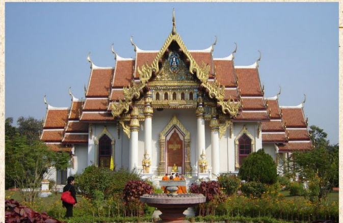
วัดไทยพุทธคยา