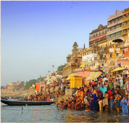
แม่น้ำคงคา