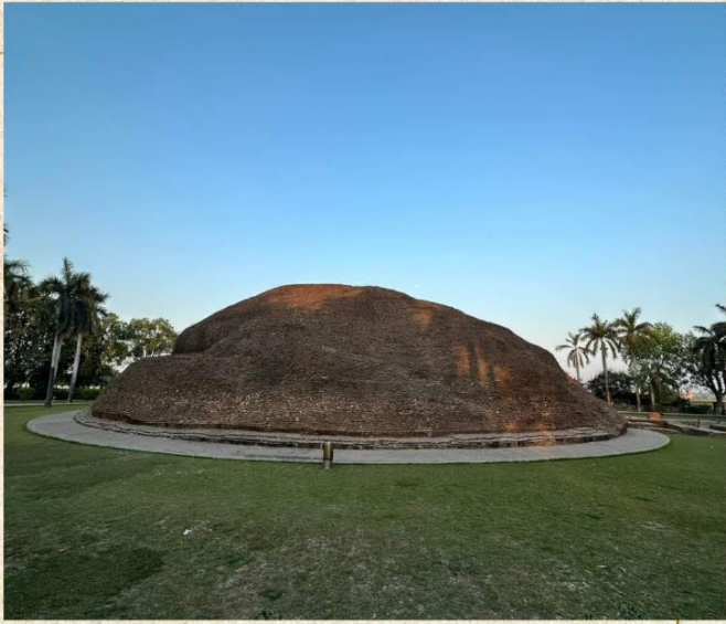
มกุฏพันธเจดีย์